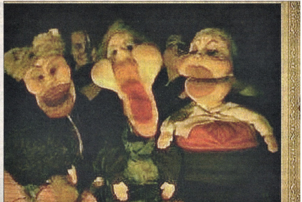
"FURIOSA". Des mégères méchantes, sales et difficiles à apprivoiser qui seront en tournée dans les bars de Limoges.

tant il est choquant, front nationalisant. Leur spectacle est une sorte de cabaret, composé de saynètes d'environ 5 minutes, parlées ou chantées. La partie textuelle est écrite sous forme de canevas sur lequel trois comédiennes